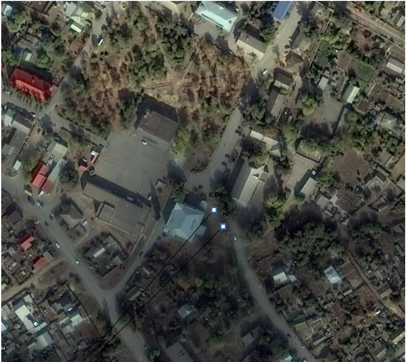
Схема предполагаемого размещения нестационарного объекта торговли в р.п. Чернышковский, ул. Советская (прилегающая территория к поликлинике МБУЗ Чернышковская ЦРБ)